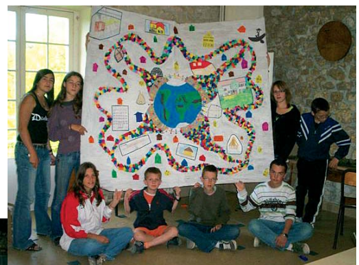
Temps d'envoi (samedi 18 août)