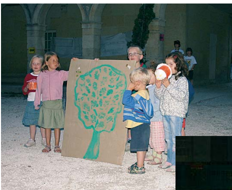
Veillée des enfants (jeudi 16 août)

Les enfants et adolescents ont préparé et animé une veillée aux parents et adultes pour leur présenter leur travail et réflexion. Ils ont également été partie prenante du temps d'envoi clôturant la session.